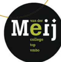
Van der Meij College bovenbouw vmbo b/k Alkmaar